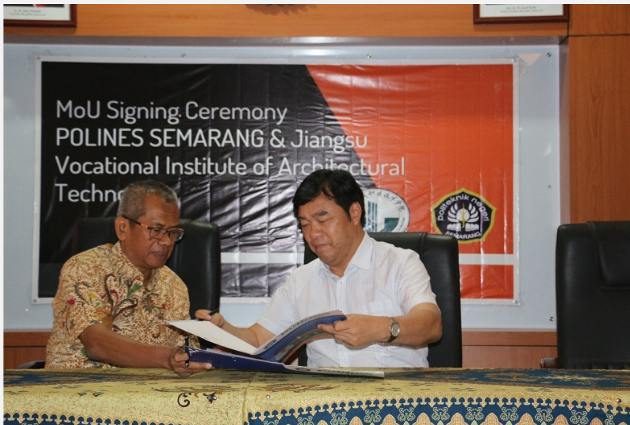
Penandatanganan Nota Kesepahaman Polines – JSVIAT China